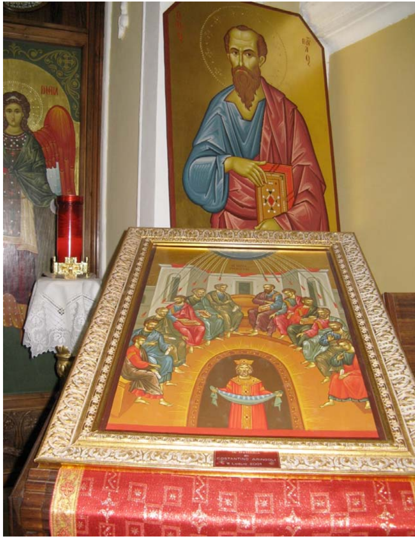
L'icona della Pentecoste

Tra i simboli di quelle “lingue di fuoco”, che mi avvincono, seguo da vicino, lungo le siepi che segnalano il percorso del mio quotidiano cammino, le foglioline della rosa canina. Dopo la lunga primavera piovosa e fredda del 2009, sta terminando in forma smagliante, in questi giorni, la sua fioritura. Da qui a poco, con il caldo che sta irrompendo, il fiore si spoglierà dei suoi petali e da qui a qualche mese, in estate, si trasformerà in bacche rosse.