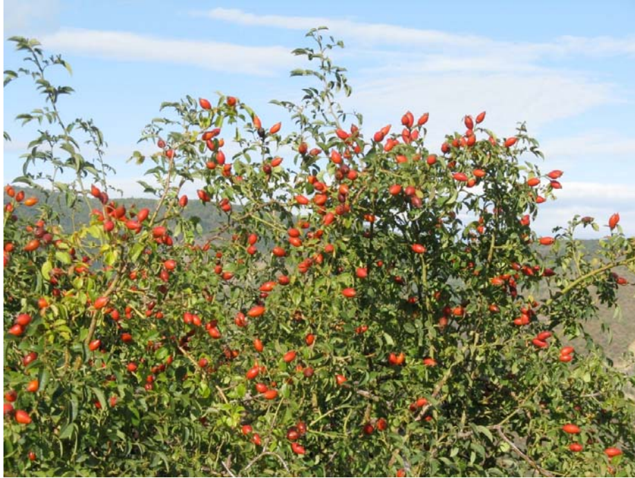
Bacche rosse di rosa canina

La rosa canina è uno dei 38 fiori di Bach, tradizionalmente usato per trattare rassegnazione, indifferenza, apatia, abulia, noia, difficoltà nella scelta degli studi. Appartiene alla natura mediterranea e conoscerla serve a valorizzare la nostra cultura e la nostra identità'.