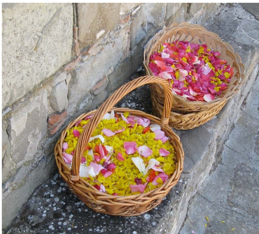
Cestini di vimini con petali di fiori

Con quei petali di fiori, raccolti nei cestini di vimini e portati dai bambini in processione, si tappezza di colori verdi, bianchi, rossi, gialli il selciato delle strade del paese e la nostra esistenza si rigenera nello spirito e nel corpo della gioia "frugale" del ricordo appena sfiorato, appena vissuto, ma saldamente ancorato al modo di mantenere viva l'avventura umana delle generazioni passate, presenti e future, che ci appartengono.