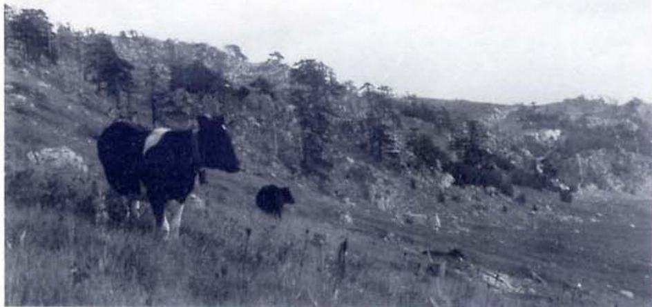
I pascoli d'alta quota dei Piani di Pollino. L'allevamento di bestiame è un'attività primaria che sul massiccio montuoso trova una importante fonte di reddito.

Il Parco, che col Progetto Pollino si intende creare, non è, infatti, soltanto un territorio, ma è anche, e principalmente, un modo di operare al suo interno per garantire le finalità sulle quali andranno a porsi le basi della sua istituzione.