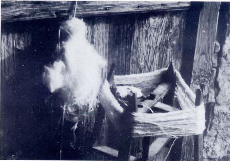
Attrezzi per la filatura della ginestra. I resti materiali della cultura locale sono motivo di richiamo per un turista sempre più attento a queste peculiari risorse. Il recupero e la valorizzazione possono creare anche interesse per nuove iniziative economiche e produttive dell'artigianato tradizionale.

individuare le attività che verosimilmente potranno essere svolte.