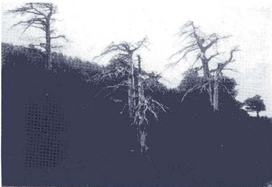
Relitti di Pino loricato immersi nelle macchie di Faggio sulla Grande Porta del Pollino. Dopo l'ultima glaciazione, il clima più mite ha favorito la progressiva risalita delle faggete. Con esse il Pino loricato è costretto, ormai, ad una dura lotta per la sopravvivenza.

Il Pollino, col suo Progetto di Parco, può ambire, invece, ad una politica di valorizzazione delle risorse; una politica di conservazione e di valorizzazione, con una netta inversione dell'uso intensivo, immotivato, episodico e distruttivo del territorio, ad una accorata, consapevole e controllata gestione della vasta gamma di attività di tutela e di valorizzazione, che la preziosità stessa delle risorse reclama.