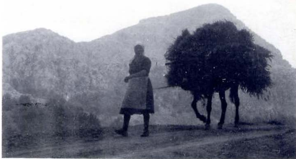
Il trasporto con l'asino dei covoni. È un quadro di vita agreste ancora animato nelle campagne del Pollino.

Il coinvolgimento e la partecipazione della società del Pollino sono una tappa obbligata, al raggiungimento della quale concorre lo sforzo di tutti