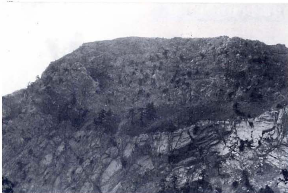
Serra delle Ciavole. La roccia dolomitica è la formazione geologica dei rilievi di Serra di Crispo (2053 m.), Serra delle Ciavole (2127 m.), Serra Dolcedorme (2266 m.), Monte Pollino (2248 m.) e Serra del Prete (2180 m.). Su queste impervie rocce trova rifugio l'ultima colonia di pini loricati.

i suoi contenuti, ma anche così nuovo come entità operante all'interno del territorio regionale nell'area più degradata, deve mettere in movimento il motore dello sviluppo fino a diventare «campione» e «pilota» per le future politiche territoriali e socio-economiche.