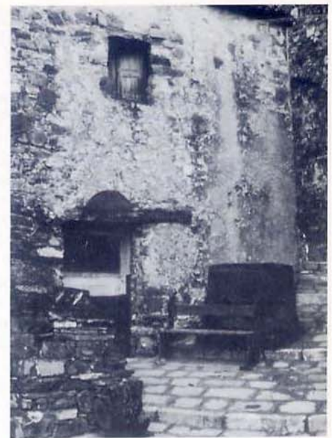
Casa contadina nel Centro storico di S. Paolo Albanese. Il riuso edilizio è una sfida ai villaggi turistici; esso può fornire ricettività turistica ai visitatori del Parco e migliori condizioni abitative ai residenti.

Non bastano i vincoli urbanistici del P.T.C.; non bastano le dichiarazioni di in-