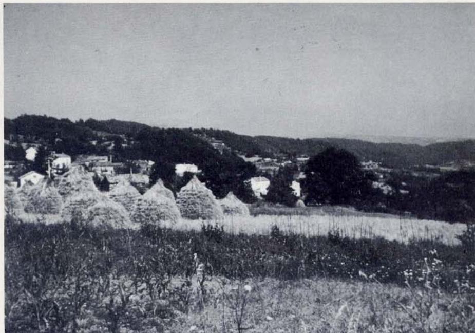
Paesaggio agrario. Attività agricole arcaiche, qual è la coltivazione del frumento, rappresentano per le famiglie contadine del Pollino un'economia di sussistenza alla quale non si rinuncia.

Gli interventi ai quali, nelle aree sottosviluppate, è sempre riuscito più difficile legare le capacità degli abitanti di comprenderli, accettarli e gestirli, riguardano le attività umane da svolgere più che le opere fisiche da costruire.