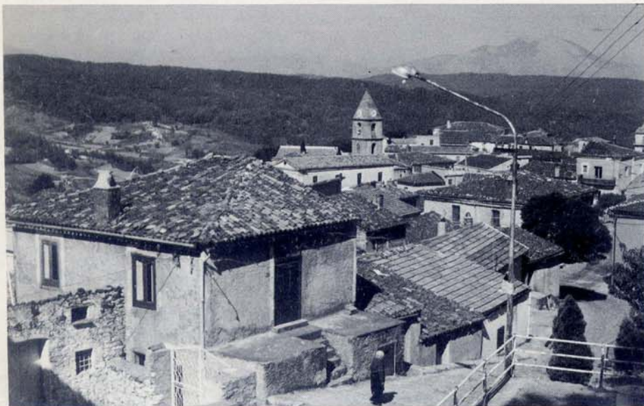
S. Severino lucano. I centri abitati alle falde della montagna sono un patrimonio edilizio-urbanistico, in gran parte non utilizzato, di rilevante valore architettonico, ambientale, storico e culturale, dal quale, con il recupero e la riqualificazione al posto delle nuove costruzioni a carattere speculativo degli Immobiliari, si possono ricavare circa 6.000 posti-letto.

Purtroppo non basta spendere, per essere certi di ricavare dalla spesa automaticamente un effetto positivo; anzi il più delle volte il rendimento dell'investimento è stato negativo; il che vuol dire che le risorse economiche e finanziarie impiegate sono risultate letteralmente sprecate. I nuovi interventi, di cui il Pollino ha urgentemente bisogno per lo sviluppo, devono avere, quindi, requisiti progettuali compiuti, comprensivi cioè anche delle estrinsecazioni e specificazioni delle modalità di esecuzione e di gestione, mancando le quali è difficile non solo preventivare i costi complessivi finali, ma anche