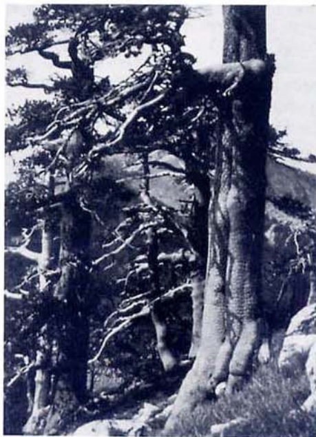
Pino loricato. Sopravvissuto alle alterne vicende determinate dalle glaciazioni quaternarie, questo autentico fossile vivente è una rarità floristica presente solo sul Pollino e sui Balcani.

Il Parco è stato inteso, per il Pollino, come l'occasione di cogliere al massimo per offrire all'abitante di questa stupenda montagna la più favorevole delle prospettive, per dare alle attività umane un moderno e redditizio