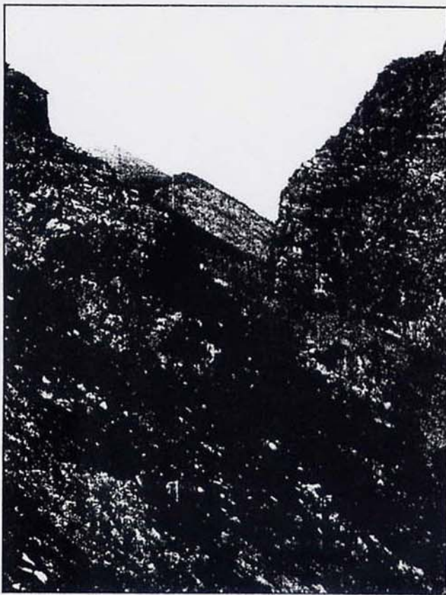
Civita: Canyon del Raganello "Sachitello"