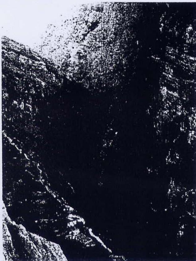
Canyon del Raganello e Ponte del Diavolo