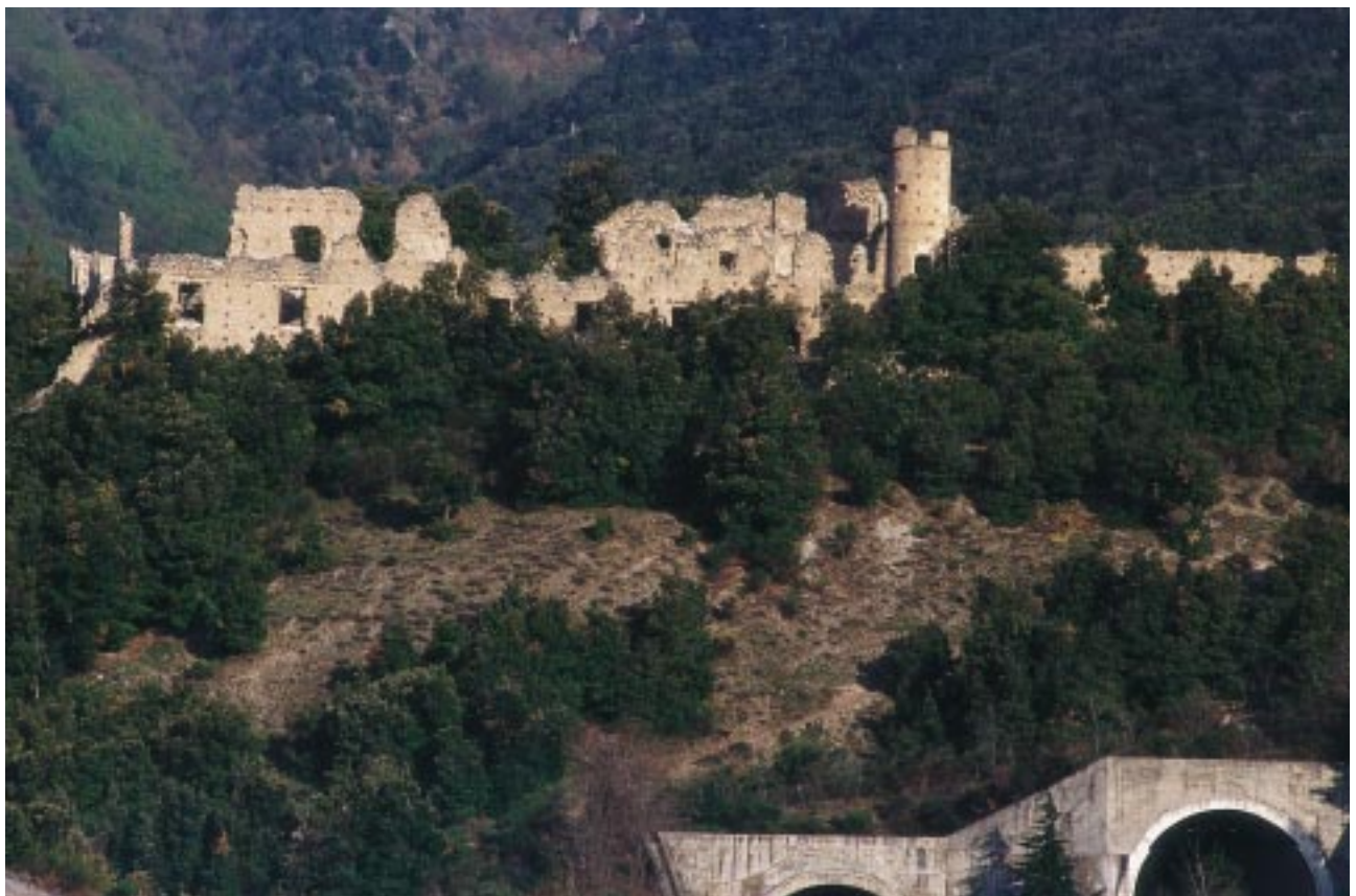
I ruderi del convento di Colloredo