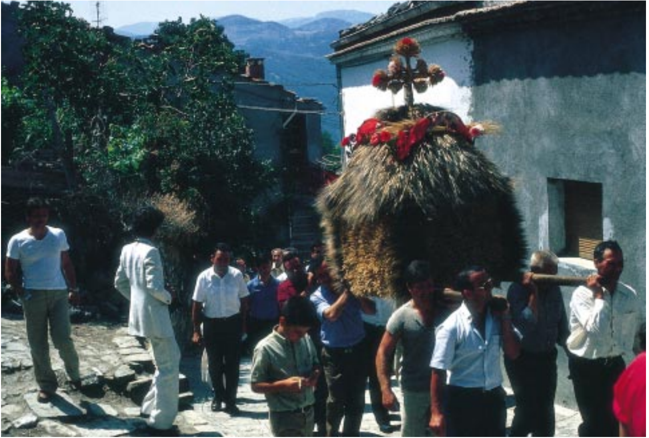
"Himunea" alla processione di S. Rocco a San Paolo Albanese