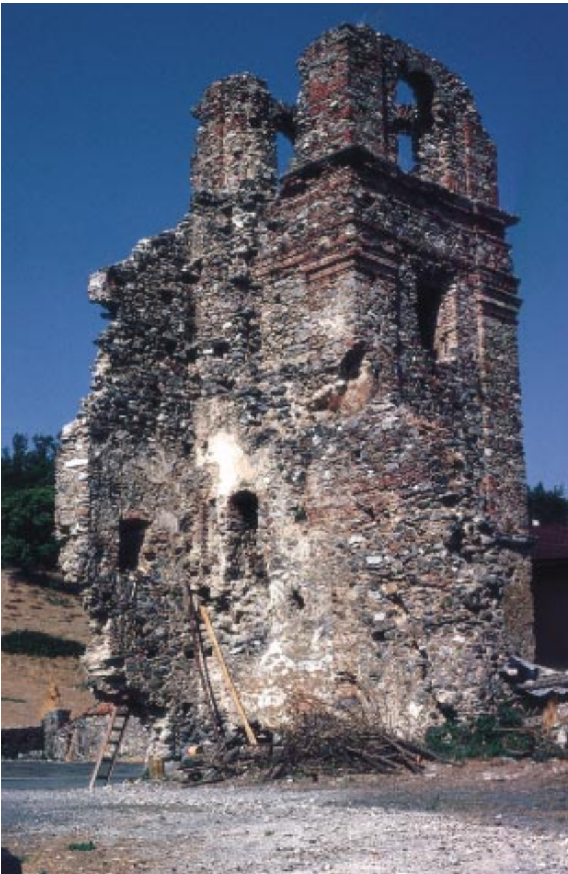
I ruderi del convento del Sagittario

16 Bozza di "Piano di Gestione del Bilancio 1999" del 13.07.1999.