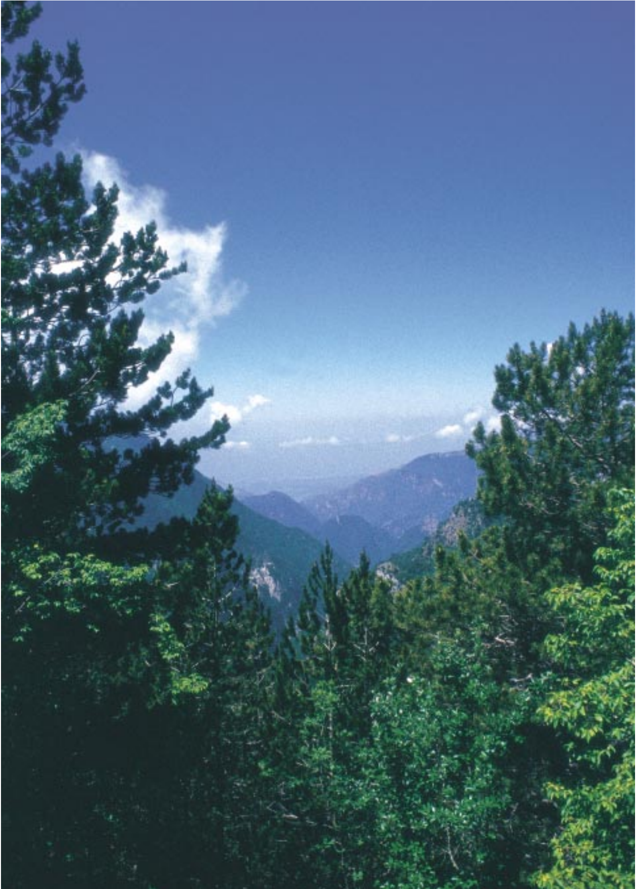
La valle dell'Argentino