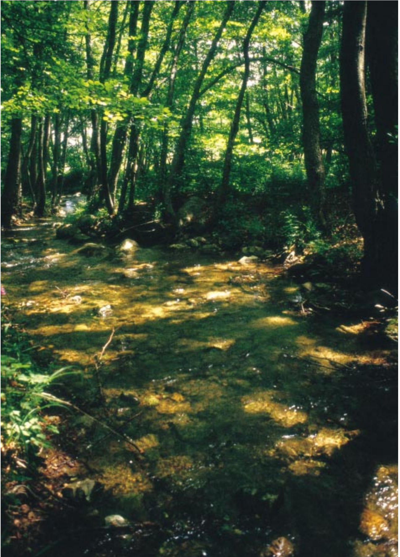
Il torrente Peschiera