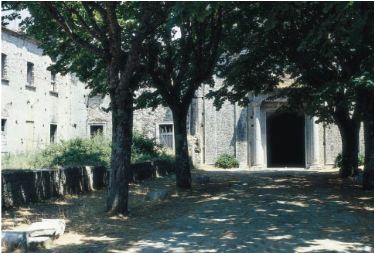
Il Santuario di Santa Maria della Consolazione a Rotonda