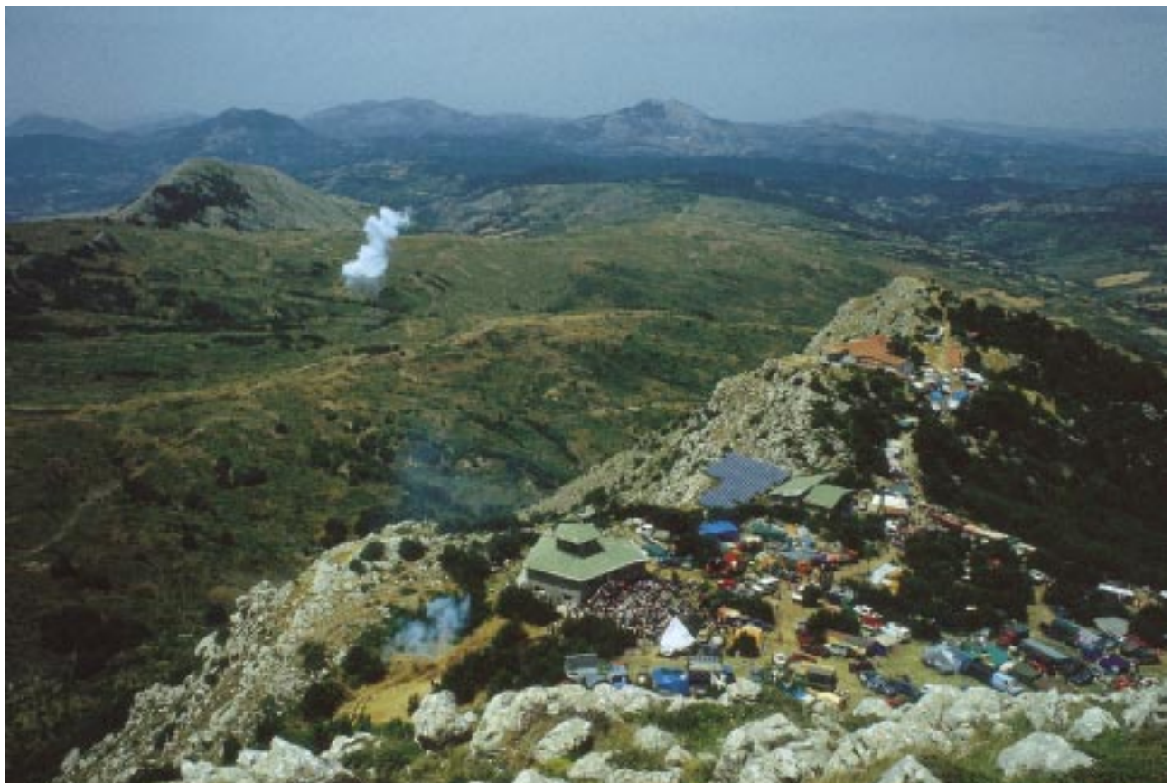
Madonna del Pollino a San Severino Lucano