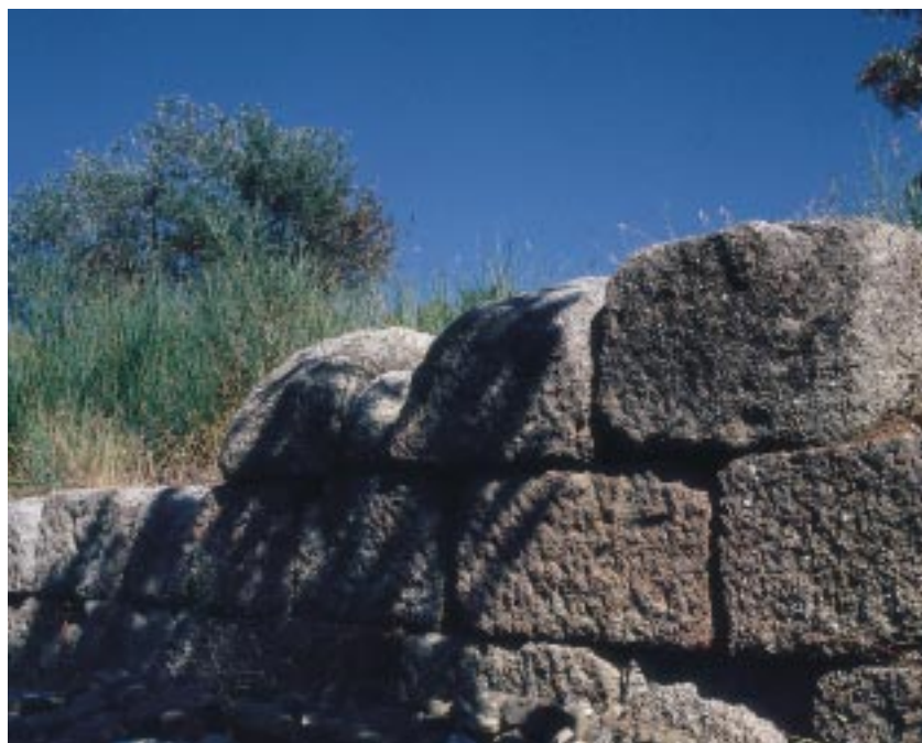
Resti di cinta muraria a Cersosimo

Per riaffermare le ragioni dell'ambiente e l'impegno a favore del Parco e dell'attività di conservazione, tutela e valorizzazione e per aggiornare il quadro delle compatibilità e delle coerenze, l'assunzione di responsabilità, cui si pensa, è una cooperazione tra i diversi