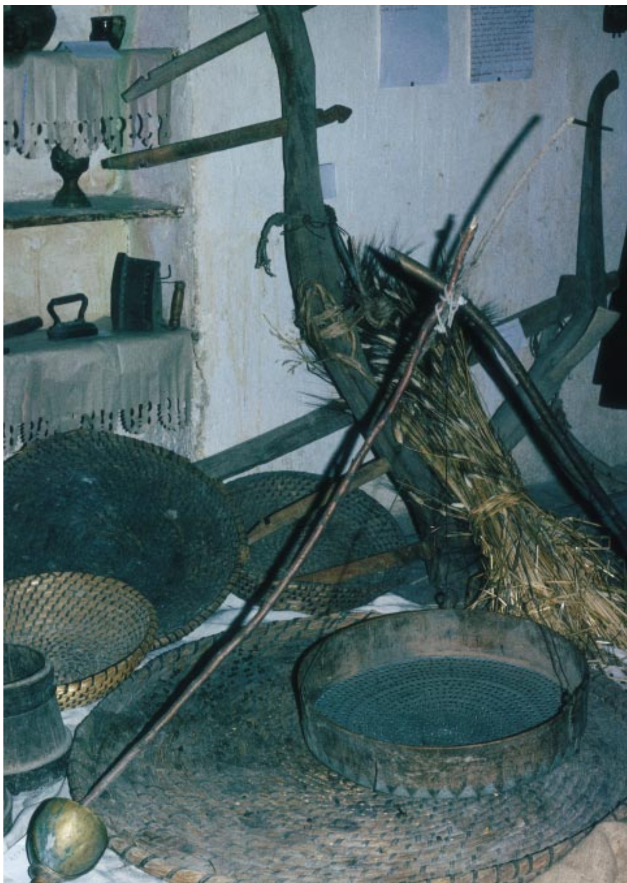
I resti materiali della cultura locale