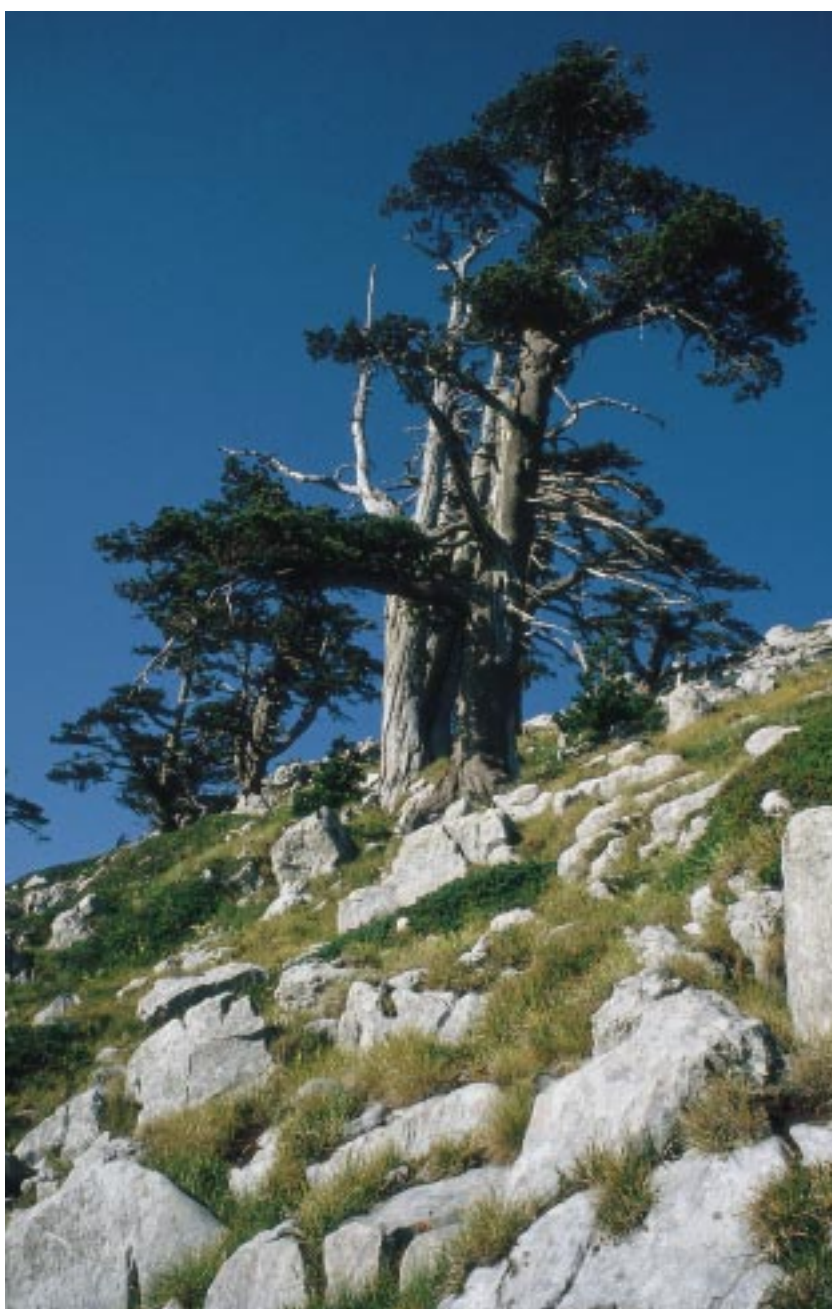
Il Pino Loricato