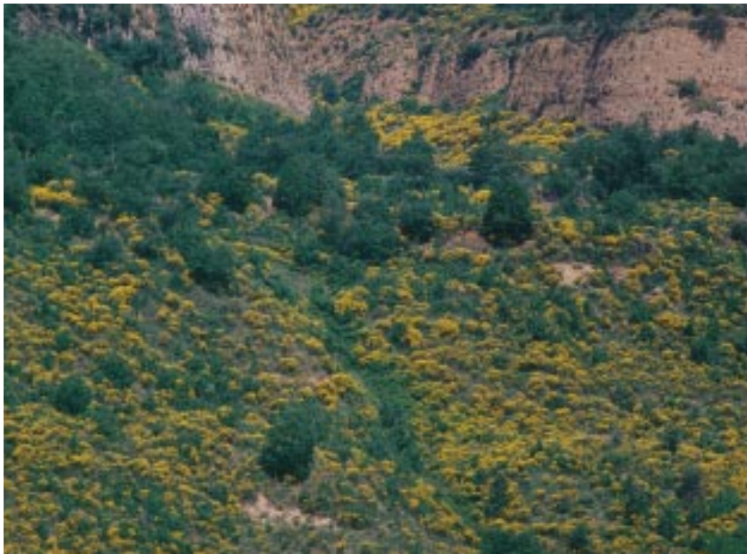
Le ginestre nella valle del Sarmento

In tale giacenza va evidenziata la “pluriennalità” della attuazione dei progetti e delle conseguenti spese, dell’ammontare complessivo di circa £. 8 miliardi, per: