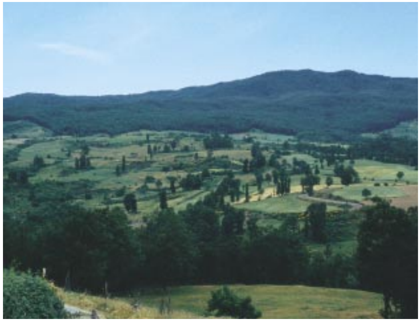
Paesaggio agrario

Tutto questo, ovviamente, senza nascondere, in termini di