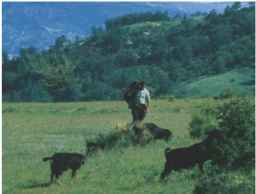
Il pastore e le caprette

Parco, Piano Pluriennale Economico Sociale, Decreto Ministeriale per la definizione di principi equitativi negli indennizzi, di cui al 2° comma dell’art. 15 della L.n. 394/91, l’Ordinamento del Personale, degli Uffici e dei Servizi, l’Ordinamento per il funzionamento degli Organi dell’Ente), • all’affollamento, nel 1998, dei Programmi approvati e