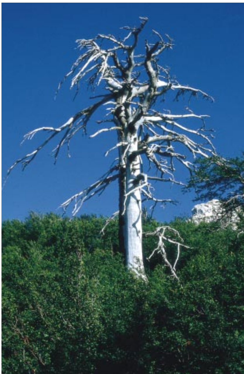
Pino Loricato assediato dalla faggeta

Non si tratta, infatti, di definire nuove idee, nuovi programmi, nuovi progetti, ma di ricondurre a “sistema” e portare a compimento provvedimenti già adottati, per i quali sono già indicati gli obiettivi da cogliere, gli adempimenti da svolgere, le scadenze da rispettare, le conseguenze che ne derivano, le