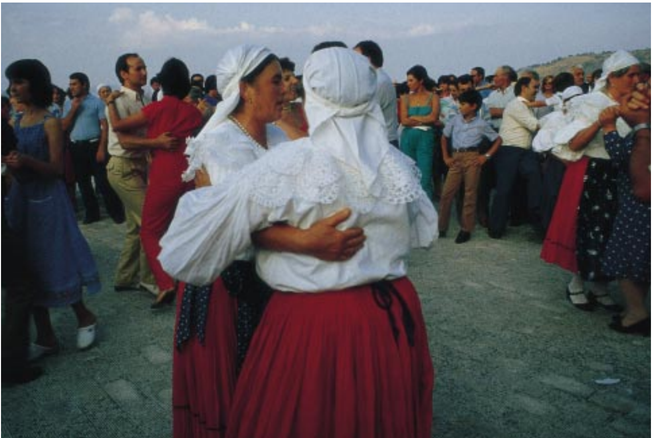
Donne "arbëreshë" in festa