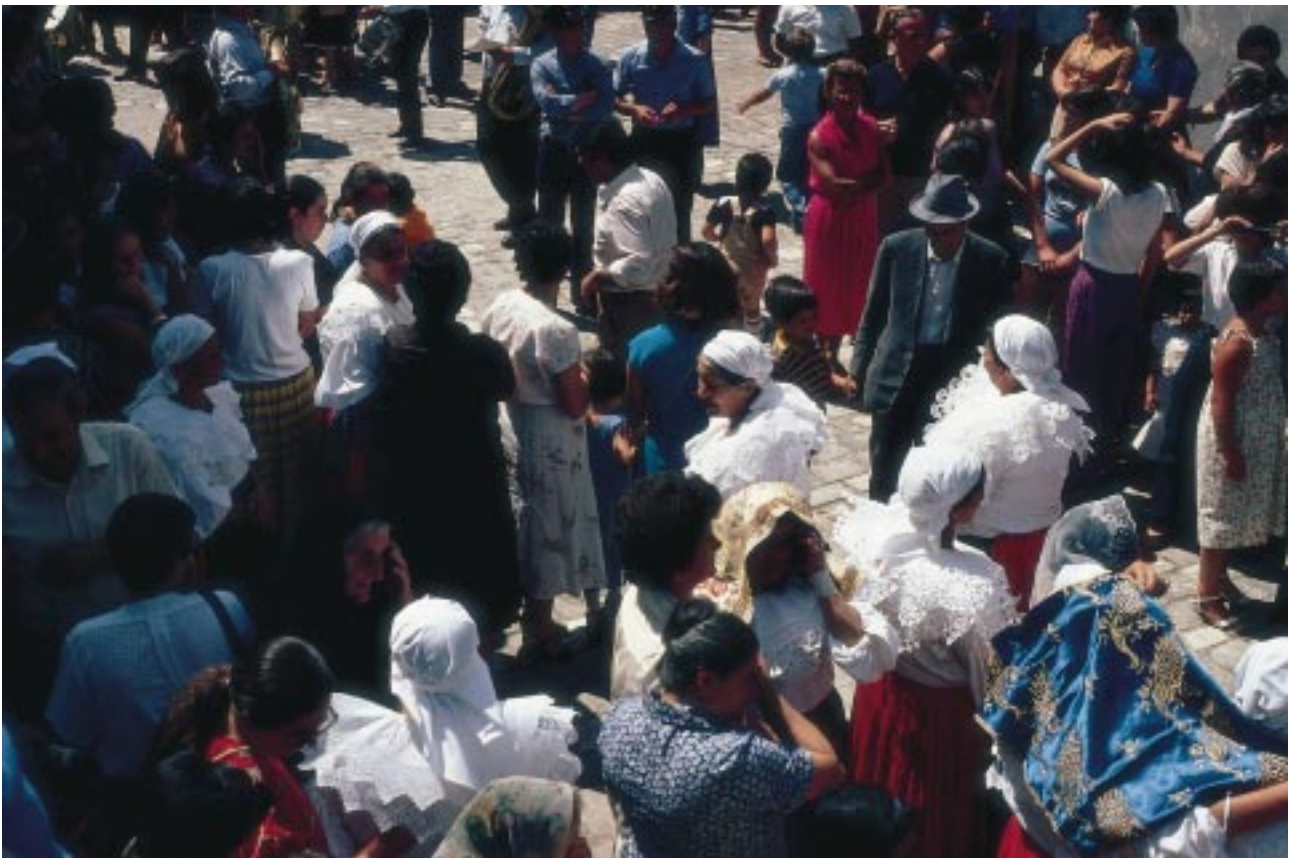
La processione di S. Rocco a San Paolo Albanese