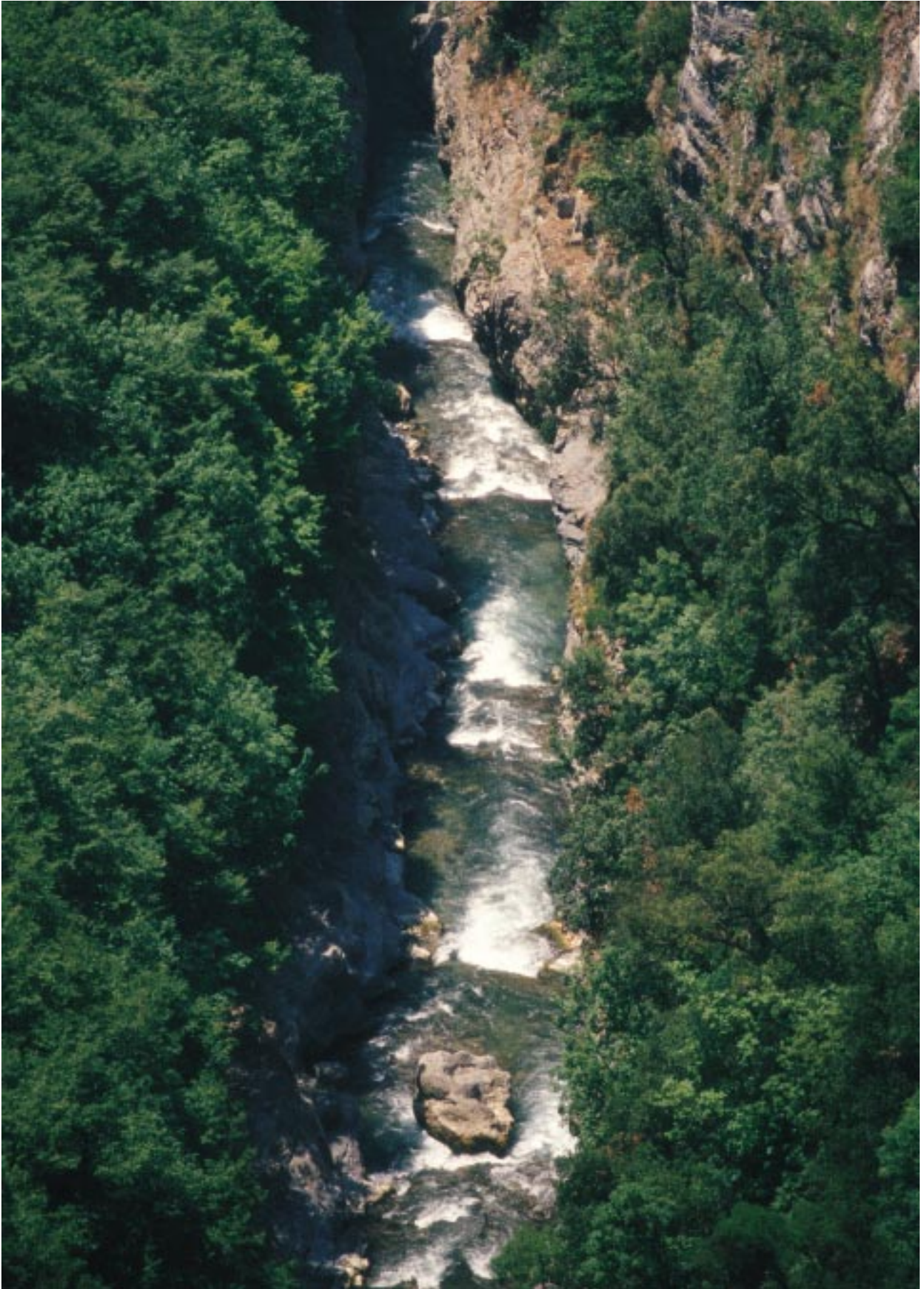
Il fiume Lao