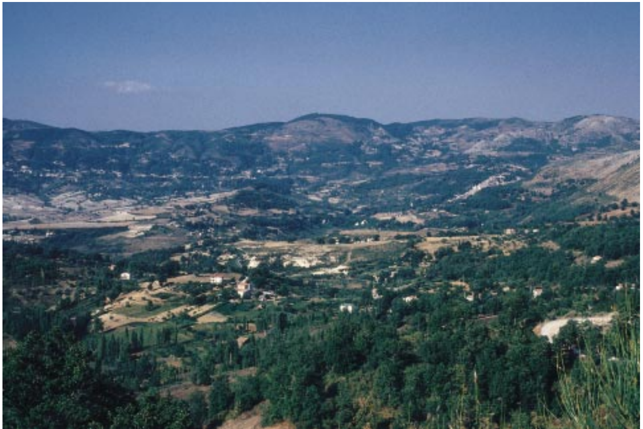
Le campagne abitate