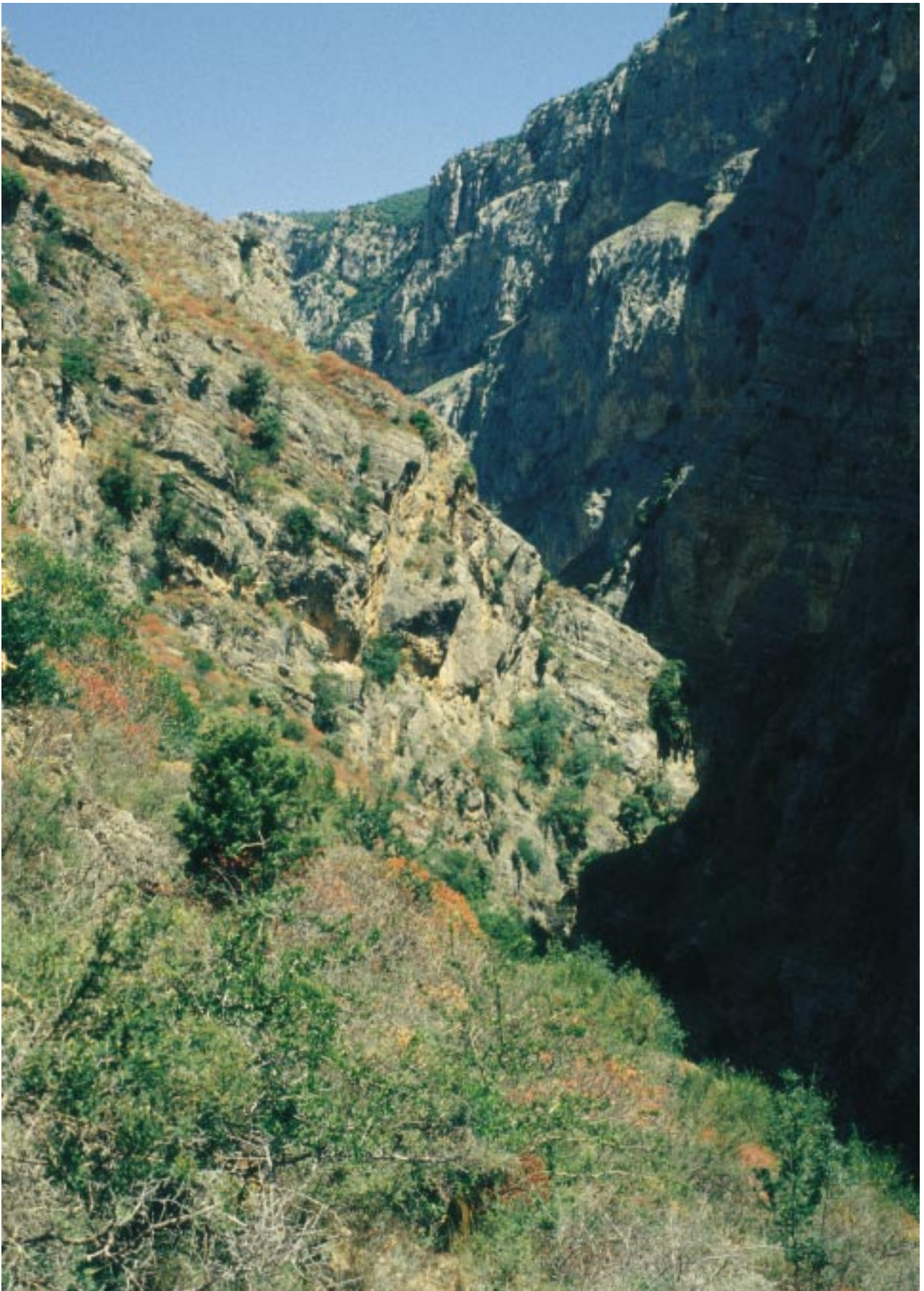
Le gole del Raganello